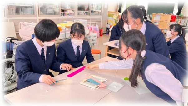
フェルトのお花づくり

梅雨の時期は雨が多く気持ちがどんよりする。 そこで、私たちはお花のクラスボードを飾って梅雨でも明るく過ごせるように したいと思った。